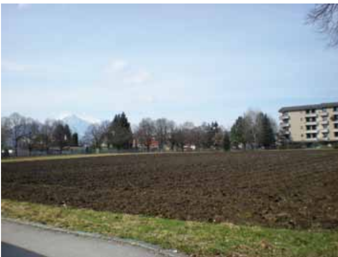
In der Rosa-Hofmann-Straße ist eine Wohnverbauung mit Schwerpunkt Generationenwohnen geplant.

300 Wohnungen, davon 75% geförderter Mietwohnbau. Ein großer Bereich ist als öffentlich zugänglicher Erholungsraum bzw. als großzügigen Grünzug geplant. Taxham ist ein ständig wachsender Stadtteil mit einer sehr guten Infrastruktur. Durch die Wohnverbauung Struberkaserne und Rosa-Hofmann-Straße wird sich somit auch der Bedarf an den verschiedensten Einrichtungen (z.B.: Kinderbetreuungsplätze) ändern. Auch der Verkehr wird zunehmen. „Man darf nicht ausschließlich die beiden Wohnbauprojekte im Visier haben, auch das daraus resultierende vermehrte Verkehrsaufkommen im gesamten Stadtteil muss im Planungsprozess beachtet werden“, so Betreuungsgemeinderätin Daniela Schinagl.