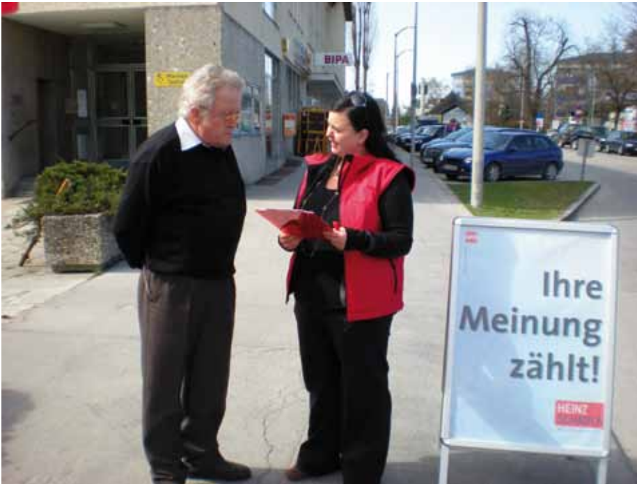
„Ihre Meinung zählt!“ – Die SPÖ befragte entlang der Klessheimer Allee die Taxhamerinnen und Taxhamer über ihre Meinung zu aktuellen Themen der Politik.

Allee die anwesenden Salzburgerinnen und Salzburger: Im Mittelpunkt standen Fragen zur Salzburger Politik und zur