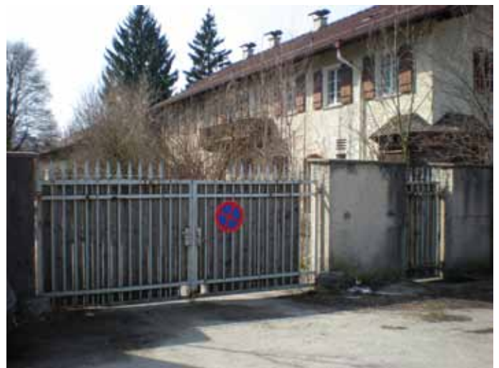
Noch sind die Tore der leerstehenden Struberkaserne geschlossen.